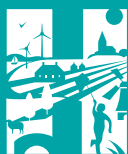
gemeente Het Hogeland

Werkplein Ability ondersteunt u om werk te vinden en te behouden. En als het nodig is bieden we inkomensondersteuning. Dit blijven we ook na 1 januari 2019 doen, maar dan